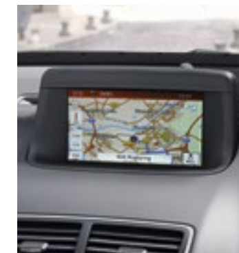
Navi IntelliLink avec écran couleur à haute résolution, 7 pouces.